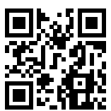
Ersatzhaltestelle Richtung Altötting